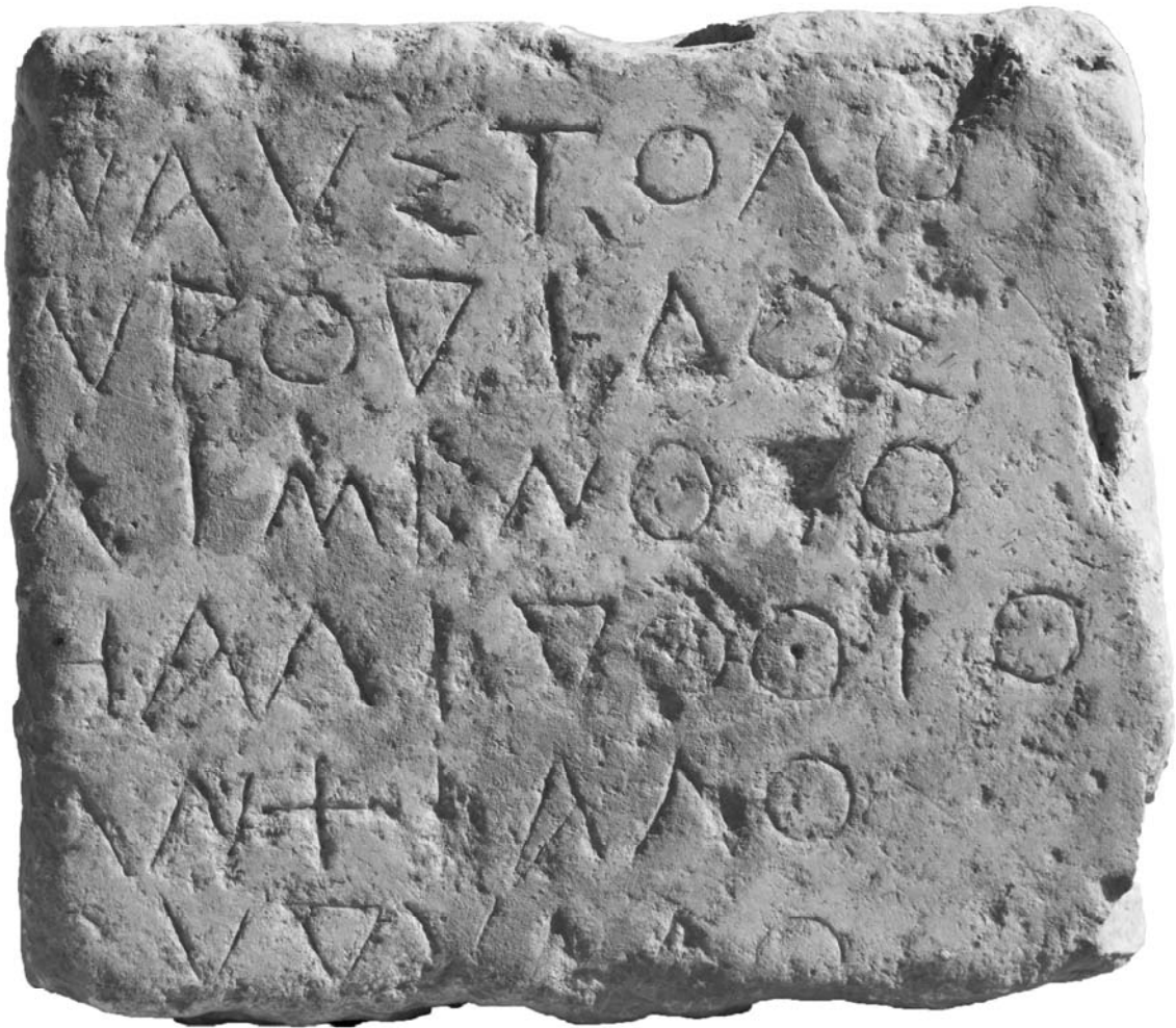
Pl. IV – Mégare. Liste de héros.

Dans son ouvrage sur la colonisation et les institutions mégariennes, K. Hanell n'avait pas inclus Poséidon parmi les divinités faisant partie du bagage des colons de Mégare. Il me semble toutefois certain que les Mégariens avaient introduit ce culte dans leurs colonies. Car Poséidon apparaît dans presque tous les panthéons des colonies, et ses rejetons, tout comme à Mégare, donnent leurs noms aux cités d'Astacos et de Byzance.