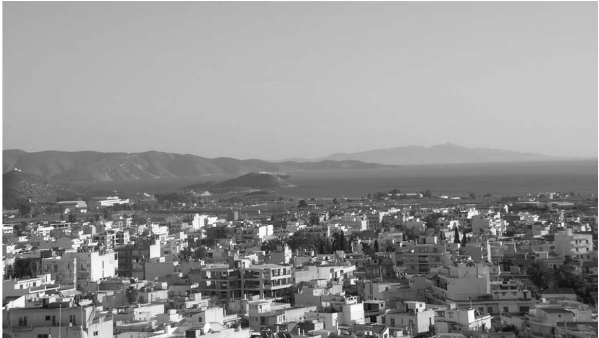
a. Vue de Pachi (en arrière plan) de Mégare, avec la colline de Saint-Georges à gauche et le Paliokastro à droite.