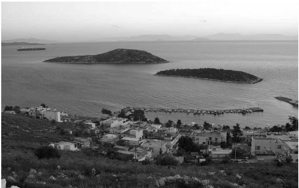
b. Vue de Pachi de la colline de Saint-Georges, avec les îles de Pachaki (en première plan) et de Pachi (en arrière plan).

Pl. I – Vues de Pachi (l'antique Nisaia).